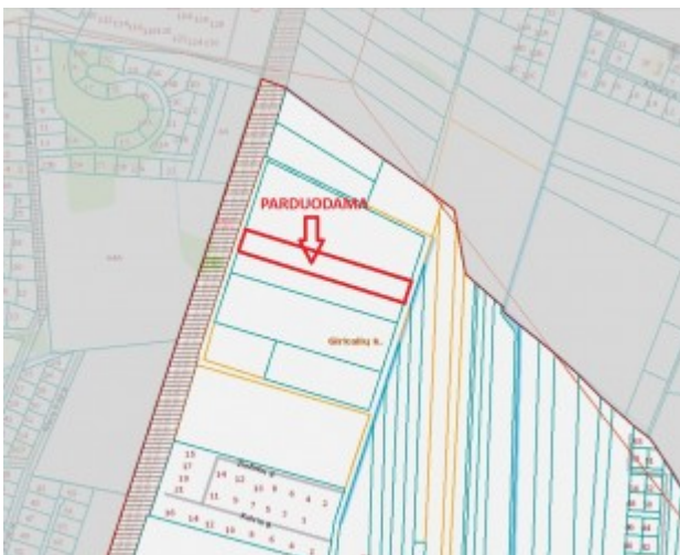
ŽEMĖS SKLYPO PLANAS M 1:2000 Sklypo plotas 12830 m 2